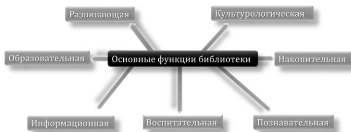
Основные функции библиотеки гимназии